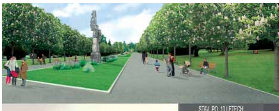
STAV PO 10 LETECH