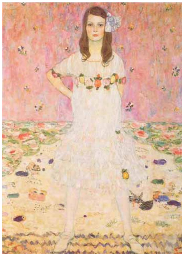
Gustav Klimt – Mäda Primavesi