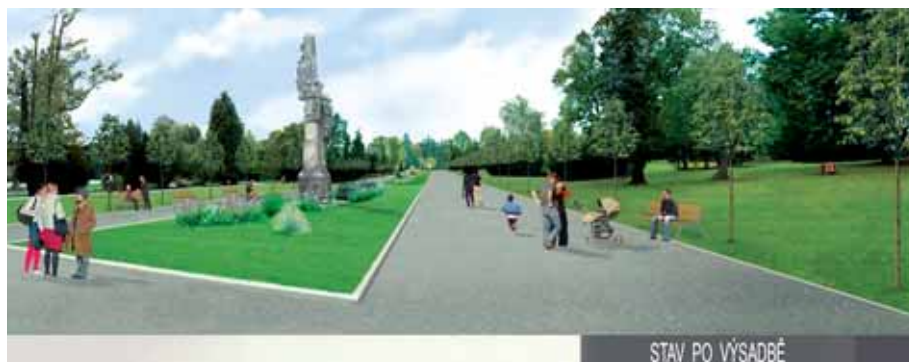
STAV PO VÝSADBĚ