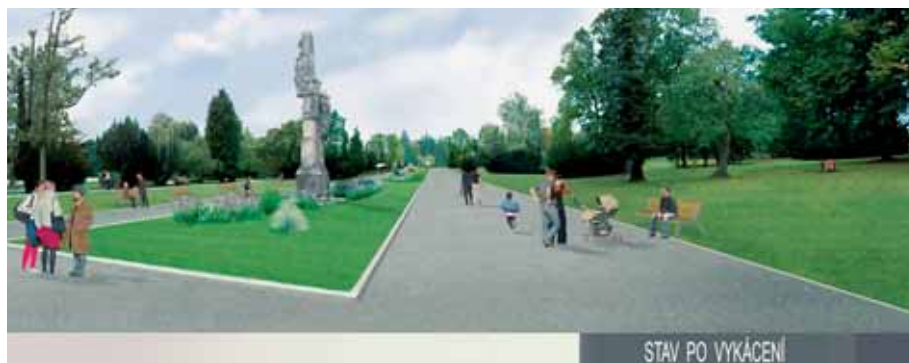
STAV PO VYKÁCENÍ